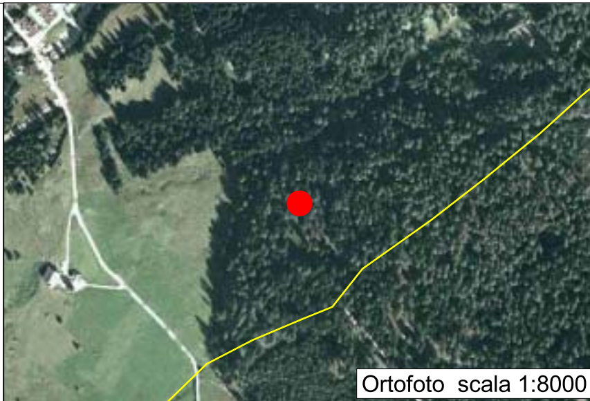
Ortofoto scala 1:8000