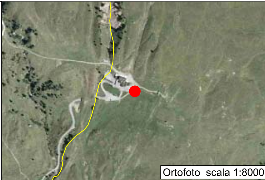
Ortofoto scala 1:8000