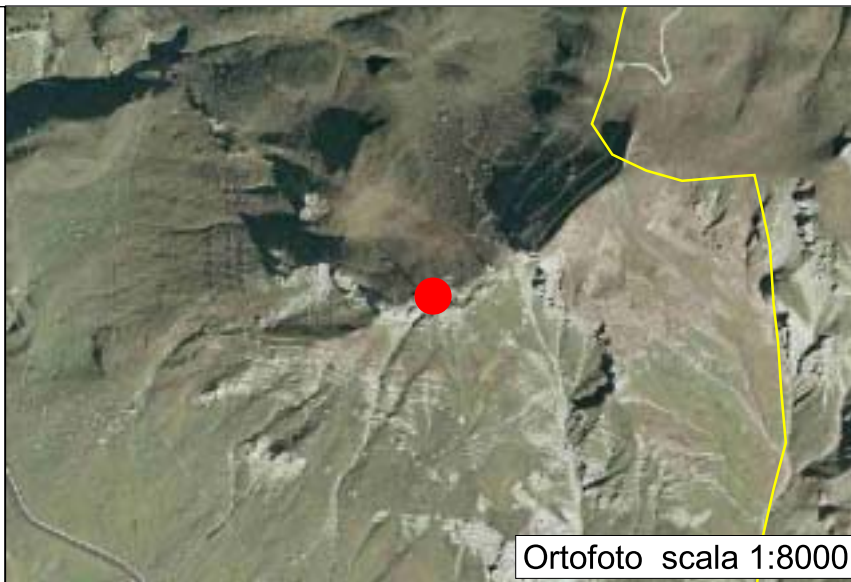
Ortofoto scala 1:8000